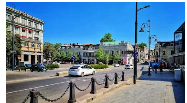
6 ზაარბრიუკენის მოედანი