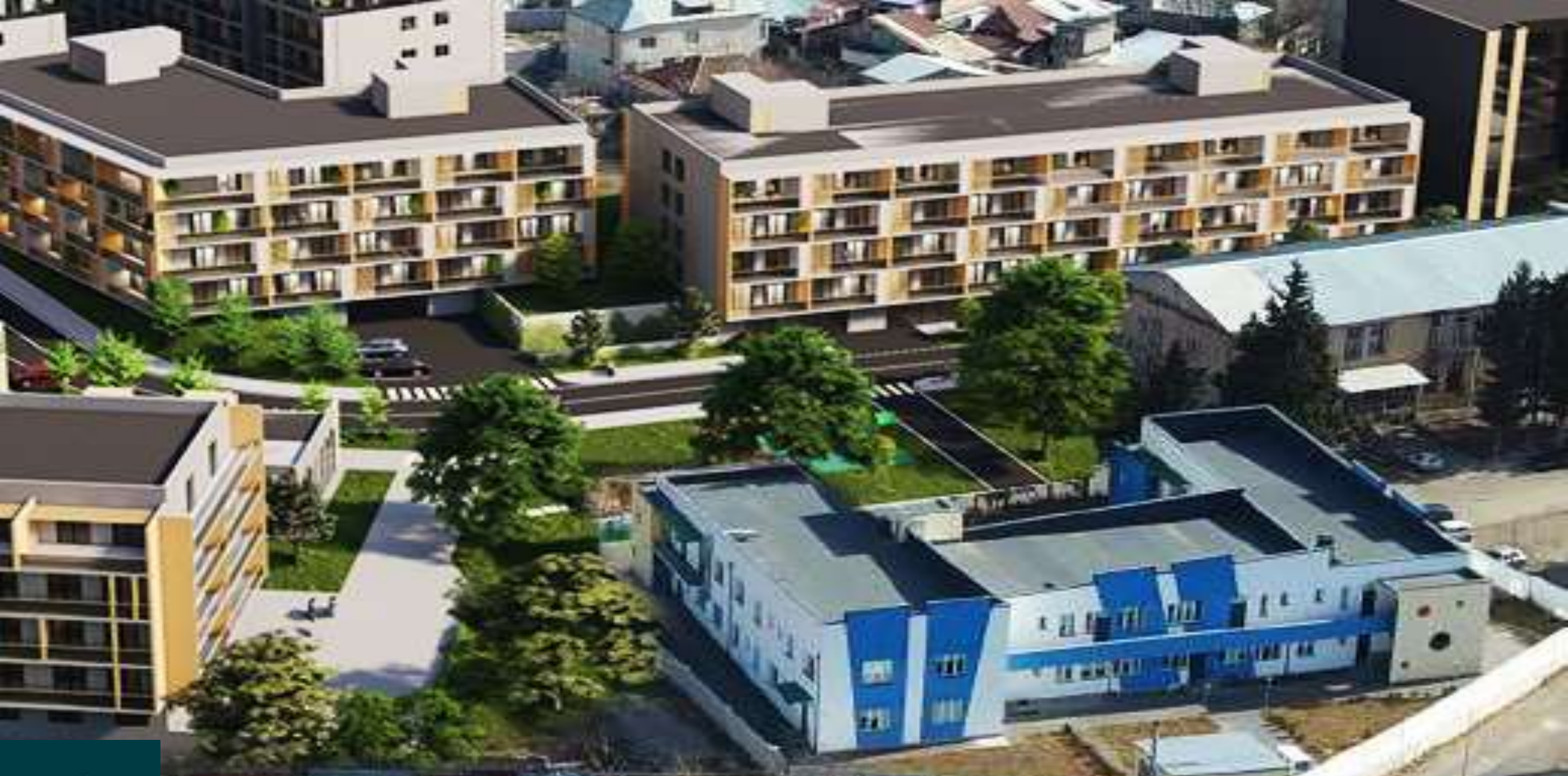
მწვანე უბნის მიმდებარედ - საბავშვო ბაღი