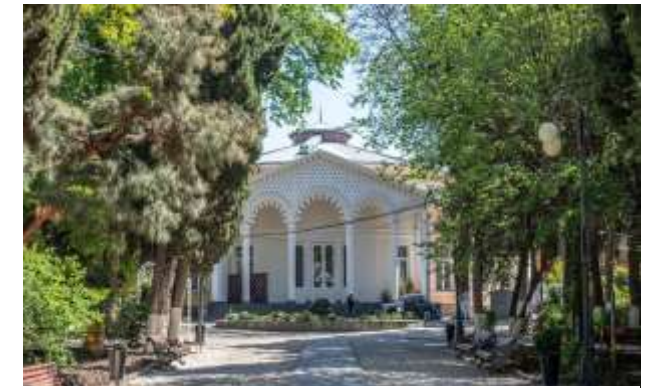
4 ილიას ბაღი