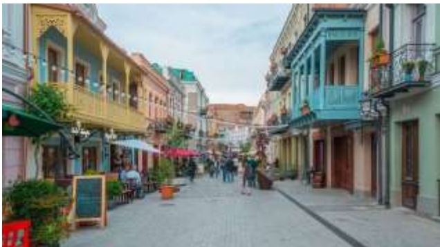
5 ახალი ტიფლისი