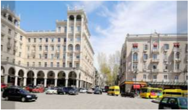
3 მარჯანიშვილის მოედანი