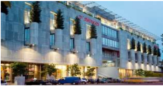
1 სავაჭრო ცენტრი ქარვასლა